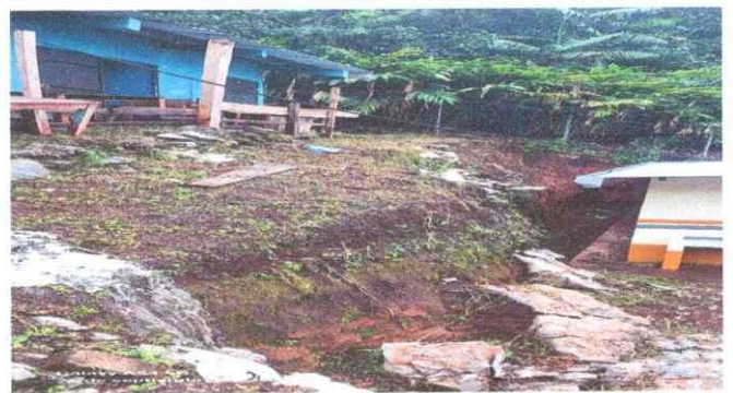
Foto 4: En este lado se estara realizando la plancha de los timnacos.