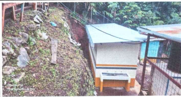
Foto 3: En esta parte se estara dando reparaciones y mantenimiento de muro ya que la cocina esta por caer por deslave.