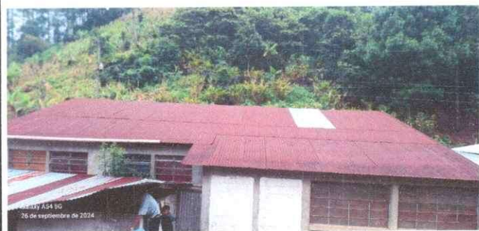
Foto 5: Es el techo que se estara camnando ya que estan ya muy oxidadas y rotas todas las laminas.