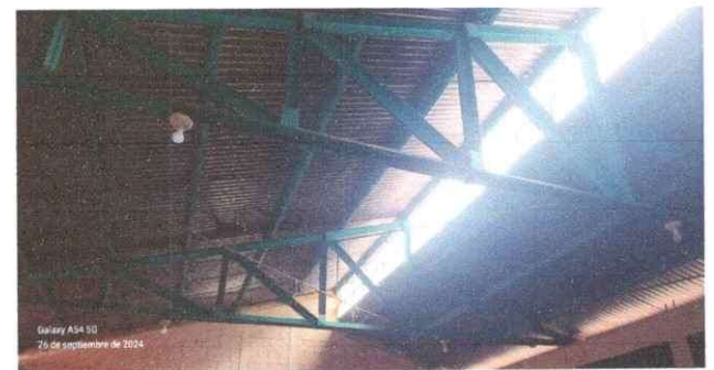
Foto 6: Esta es el aula que se estara dado mantenimiento de pintura y soldadura.

Observación: Si es necesario se pueden agregar hojas adicionales y actualizar el número de hojas.